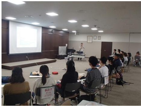
[2018/9/30] 江南厚生病院主催『第14回ICLS講習会』を開催しました。(受講者23名)