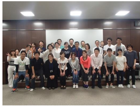
[2017/6/10~11] 日本 ACLS 協会主催『ACLSヘルスケア プロバイダーコース (2日間)』を開催しました。(受講者17名)