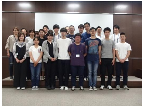
[2017/12/9~10] 日本 ACLS 協会主催『ACLSヘルスケア プロバイダーコース (2日間)』を開催しました。(受講者18名)